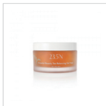
東方美人茶平衡凍膜 100mL