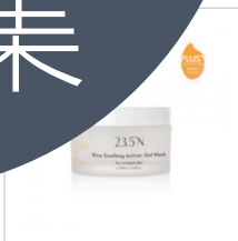
【新升級】米粹舒緩活酵凍膜 100mL