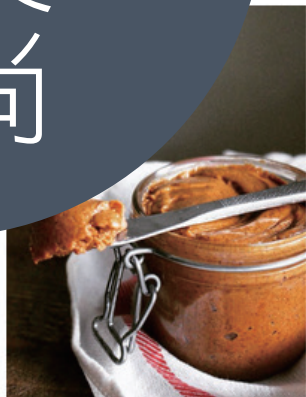
料理網紅 / 2018-06-03 by usc_bestcooking usc_bestcooking

自製濃醇香「蜂蜜肉桂杏仁抹醬」! 🐝 The Culinary Pair 姊弟煮廚