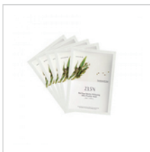
紅薏仁白潤羽透氧面膜(盒) 28mL*5pieces