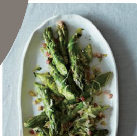
Absurdly Addictive Aspa... by kaykay