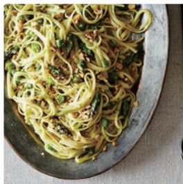
Creamy Asparagus, Lemon... by Flirty Foodie