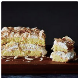
"World's Best Cake" wit... by Sarah Jampel