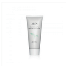
東方美人茶平衡清潔泥膜 120mL