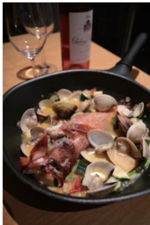
分享食譜 / 2018-05-28 by usc_bestcooking usc_bestcooking