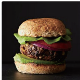
Black Bean and Corn Bur... by Gena Hamshaw