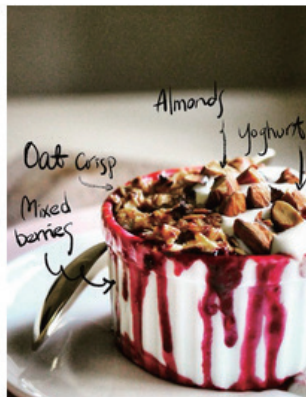
料理網紅 / 2018-06-03 by usc_bestcooking usc_bestcooking

自製濃醇香「蜂蜜肉桂杏仁抹醬」! 🐝 The Culinary Pair 姊弟煮廚