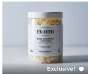
Marseille Soap Flakes