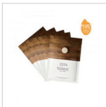
【新升級】米粹舒緩活酵羽透氧面膜(盒) 28mL*5pieces