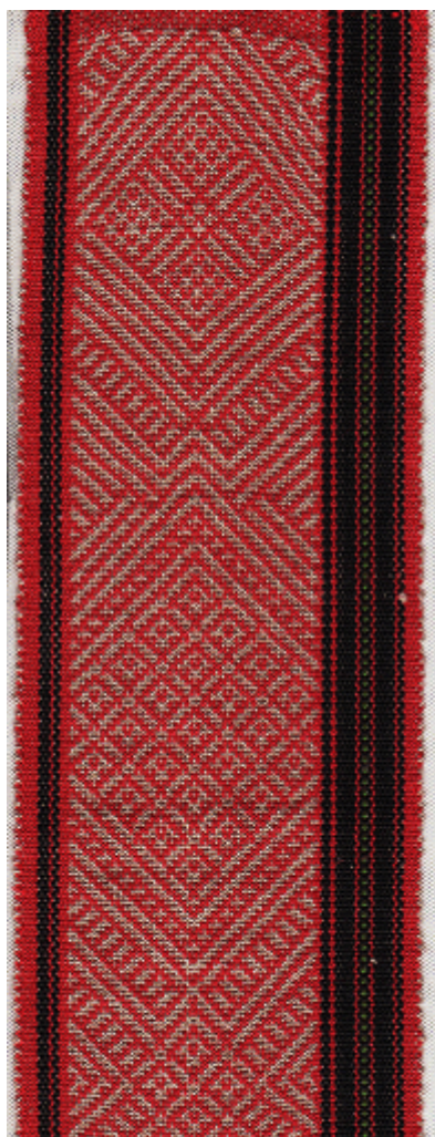
展出作品「紅紋」 賽德克族經典織物研究