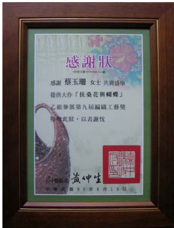
2007/08 受邀參加第九屆編織工藝獎特展