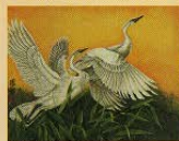
詞緒前程(繪畫)/范鳳琴