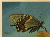
東方黑色金鳳蝶/黃翠華

座談會：96/08.19 (15:45~17:30) (織造工藝創作與造形整合)