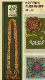
扶桑花與蝴蝶 (裝飾圖案與麻帶) /蔡玉璫