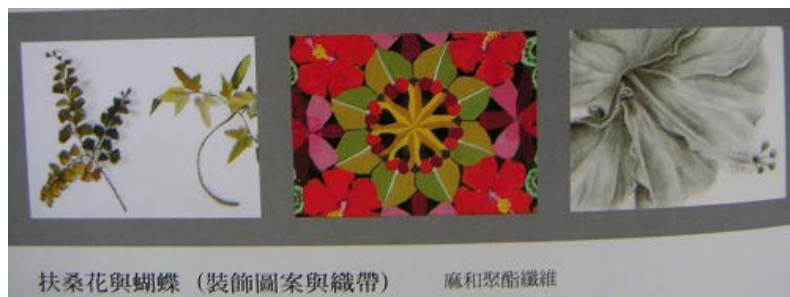
專輯中 P.36.「扶桑花與蝴蝶」圖片