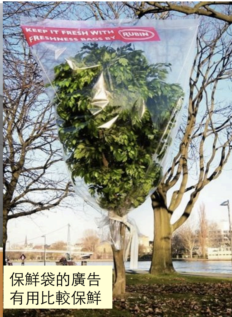
保鮮袋的廣告 有用比較保鮮