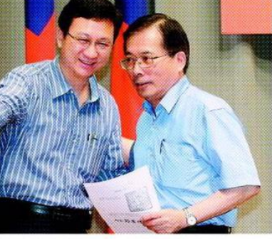
行政院發言人童振源(左)與勞動部長郭芳煜(右)宣布,七休一暫緩實施兩個月,讓交通運輸、媒體等行业暫時鬆了口氣。

【記者陳智華、程嘉文/台北報導】原定明天實施的勞工強制「七休一」政策,引發產業反彈,行政院昨晚拍板延至十月一日上路。勞動部長郭芳煜指出,因取消「例假可挪移」函釋,但規範七天一定要休一天的法律文字不精確,將利用這兩個月訂定裁量基準。至於目前執行七休一會碰到問題的行業,包括運輸業、媒體業及領隊導遊等,勞動部將再會同事業主管機關討論,「會有特別彈性考量」。