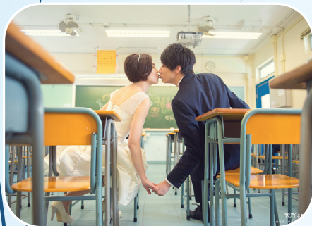
回到最初相 遇的時刻